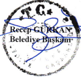
Recep GÜRKAN Belediye Başkanı

İşaretle yapılan oylama sonucunda; Edirne Şoförler ve Otomobilciler Esnaf Odası 26.07.2023 tarih ve 2023/39 sayılı yazısındaki "Edirne Belediye Meclisi'nin 04.10.2005 tarih ve 2005/135-390 sayılı Meclis Kararı ile kabul edilen Edirne Belediyesi Taksi Yönetmeliği Geçici Madde:5'te belirtilen 31.12.2022 ibaresinin 30.06.2024 olarak değiştirilmesi" taleplerinin uygun görüldüğüne oy birliği ile karar verilmiştir.